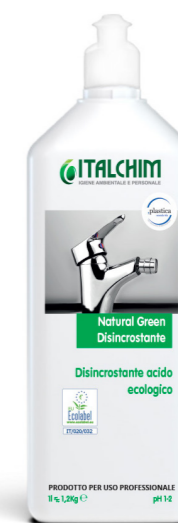
COD - 250ECOLAB