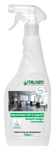
COD - 302ECOLAB

Confezione: 12 flaconi da 750 ml con spruzzino.