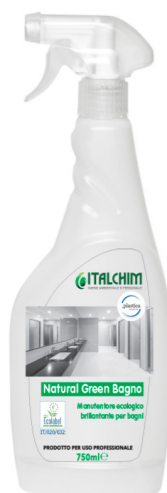
COD - 2480ECOLAB

Confezione: 12 flaconi da 750 ml con spruzzino.