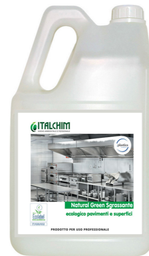
COD - 2474ECOLAB/5