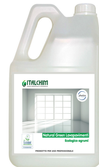
COD - 125ECOLAB