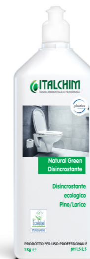
COD - 133ECOLAB