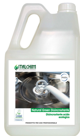
COD - 111ECOLAB