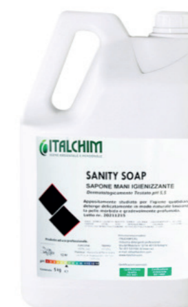
COD - 185 IGIEN