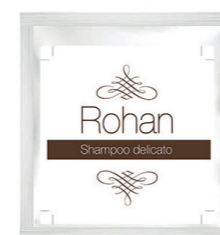
COD - 53