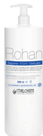
COD - 377