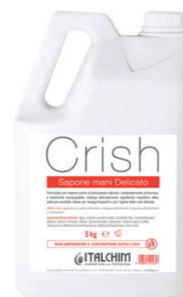
COD - 185