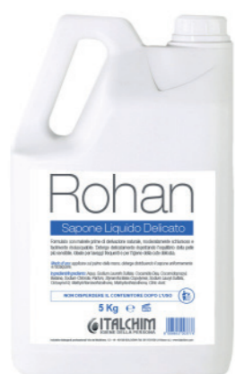
COD - 96