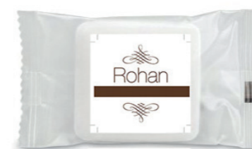
COD - 92