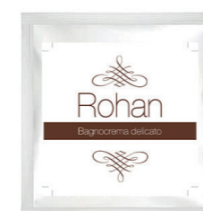
COD - 54