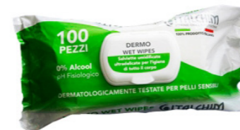
COD - 193/100