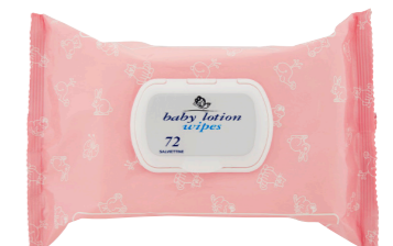
COD - 193IVALDA

Con pH fisiologico Pacchetto 10 pezzi. 12 confezioni.